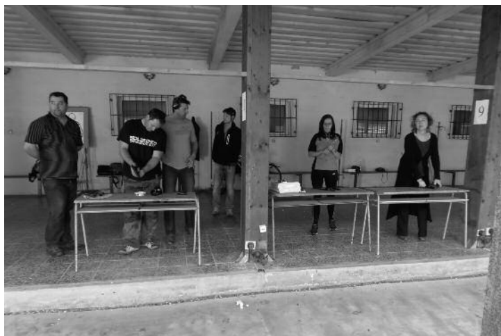
Studenti školy při střelbách