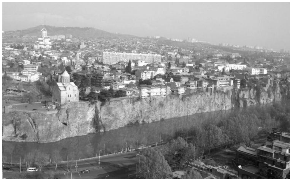
Pohled na město Tbilisi, prezidentské volby 2008

Volební den se začíná velmi brzy - týmy, které mají vzdálenější oblast k pozorování zahajují svou činnost třeba již ve 4 hodiny ráno, aby se dostavily na otevření volební místnosti včas. Každý tým má dotazník, ve kterém postupně vyplňuje výsledky pozorování - zda je místnost v obležení voličů, zda jsou urny řádně zapečetěné, zda není v místnosti a okolí propagační materiál nějaké z volebních stran či kandidátů a mnoho dalších údajů. Jeden z týmu zapisuje, druhý si povídá s členy komise, většinou předsedou volební komise. Přitom se pozoruje chování členů komise, voličů, okolí, atmosféra. Dobrý pozorovatel je nenápadný, stojí opodál a nestrhává na sebe pozornost. Často je tým kontaktován lidmi, funkcionáři