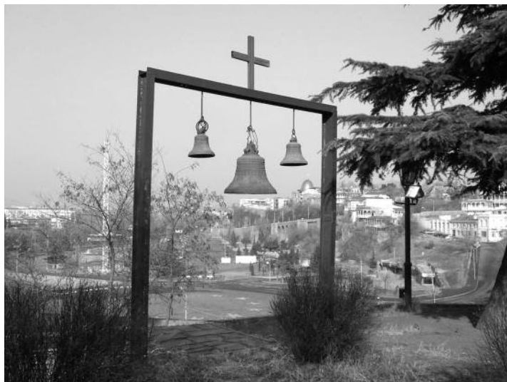
Tbilisi, prezidentské volby 2008

OBSE většinou nominované pozorovatele potvrdí, ti následně cca 5 dnů před volbami dorazí do hostitelské země. Obecně bývá problém s dopravou, protože některé pozorovatelské mise čítají i přes 1000 krátkodobých pozorovatelů, kteří se musí dostavit na úvodní briefing, který bývá 3 dny před samotnými volbami. Takže je možné, že někteří pozorovatelé dorazí třeba 4 dny před samotným briefingem. Briefing v sobě zahrnuje vše - od oficiálního přijetí přes informace o politické situaci, médiích, bezpečnostní situaci až po představení jednotlivých LTO a dalších ryze organizačních informací.