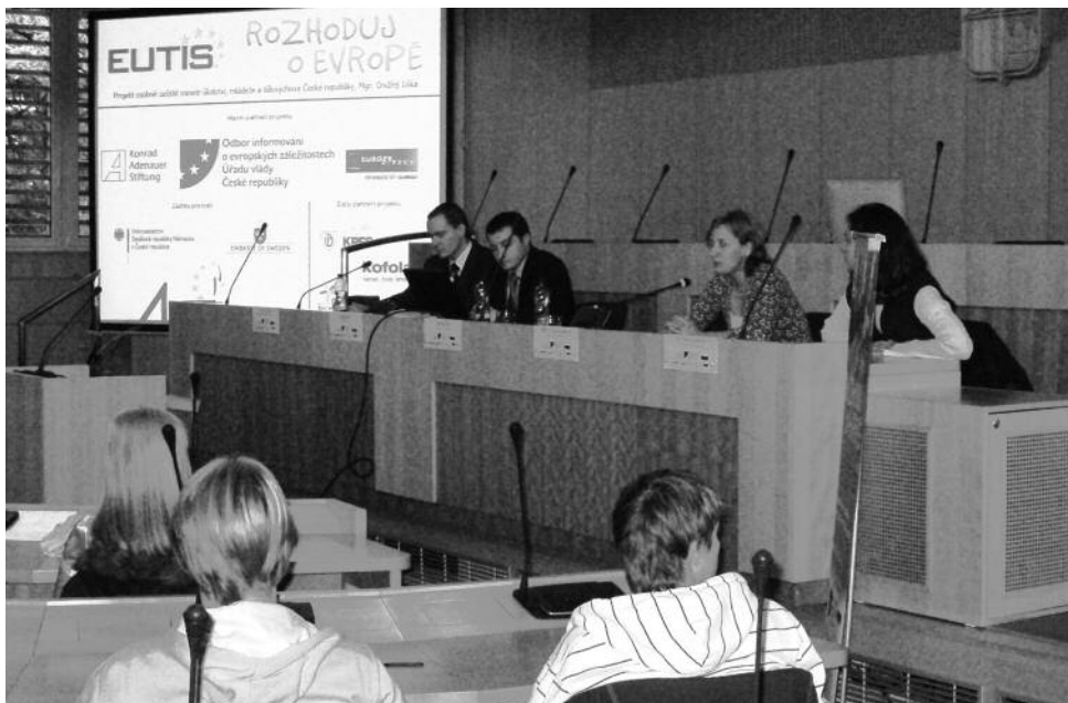
Projekt byl podpořen odborem informování o evropských záležitostech Úřadu vlády České republiky Projekt osobně zaštitil ministr školství, mládeže a tělovýchovy České republiky, Mgr. Ondřej Liška