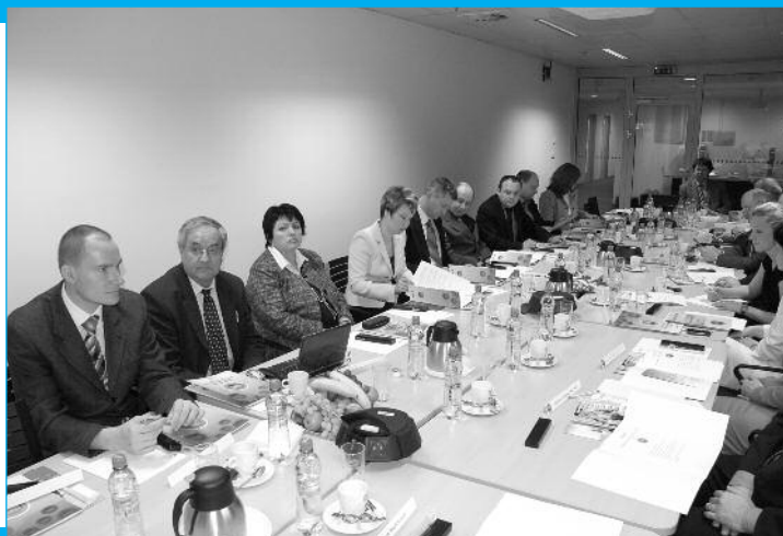
29. března - před jednáním konference zasedala také Akademická rada VŠERS