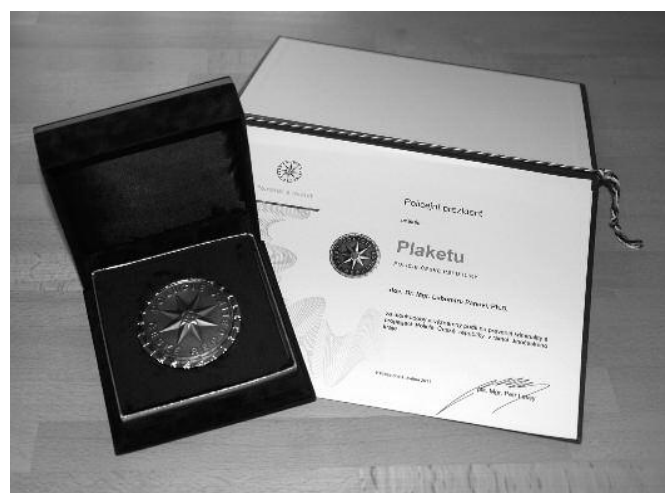
Policejní prezident plk. Mgr. Petr Lessy udělil Plaketu Policie České republiky kvestorovi VŠERS. Plk. Mgr. Ing. Radomír Heřman, ředitel jihočeského krajského ředitelství Policie ČR poděkoval při předání plakety všem akademickým pracovníkům VŠERS za dlouhodobý a významný podíl na prevenci kriminality a propagaci Policie ČR.