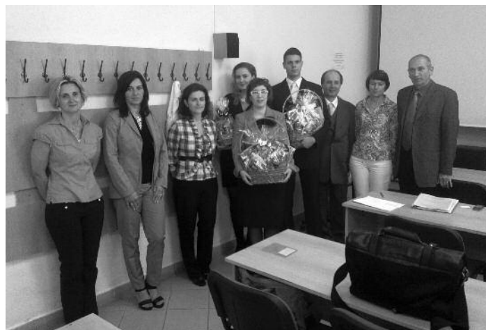
SVOČ České Budějovice