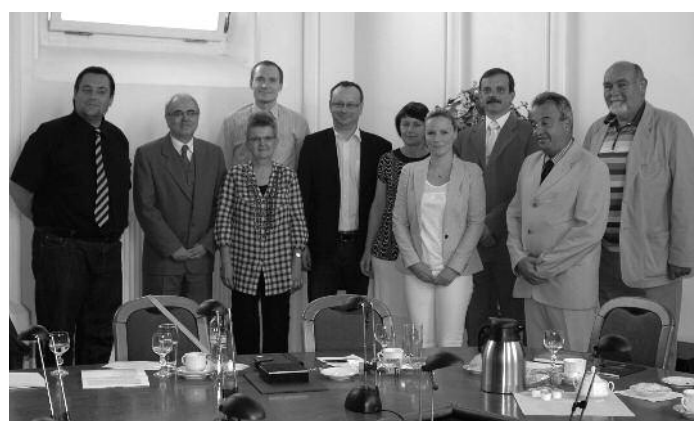
V květnu zasedalo kolegium rektora VŠERS. Hostitelem bylo krajské ředitelství Policie ČR.