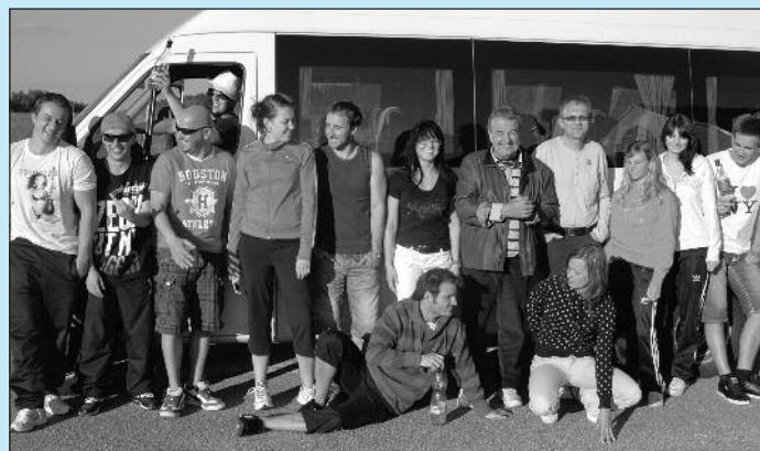
Studenti II. roč. bakalářského programu Marketing služeb zorganizovali turistický zájezd do Maďarska v rámci předmětu Turistický ruch a lázeňství.