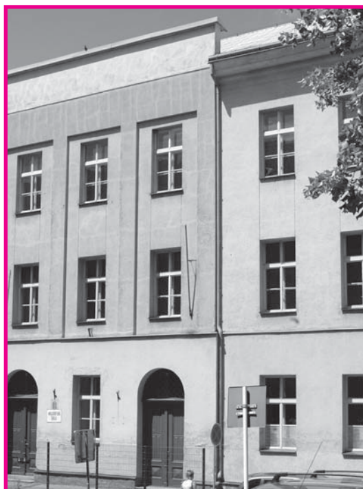
Detašované pracoviště VŠERS v Příbrami se přestěhovalo do nové budovy

V díle „Kritika praktického rozumu“ (1787) se Kant zabývá mravním svědomím, které nás nutí jednat proti našemu osobnímu prospěchu a sobectví. Díky tomu i ten nejšpatnější člověk ví, jak se má nebo jak by se měl chovat a jednat. Je zde velký protiklad mezi skutečným chováním a chováním, ovlivněným mravním svědomím. Jsme tak součástí dvojího světa: svým tělesným organismem jsme součástí světa jevů, ale svou duší jsme součástí světa o sobě. Člověk je potud ušlechtlejší a lepší, pokud dokáže poslouchat svůj vnitřní hlas a řídit se jím.