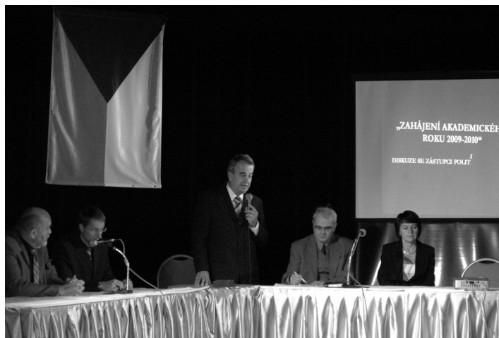
Zahájení akademického roku 2009/2010 spojené s besedou o aktuální politické situaci.