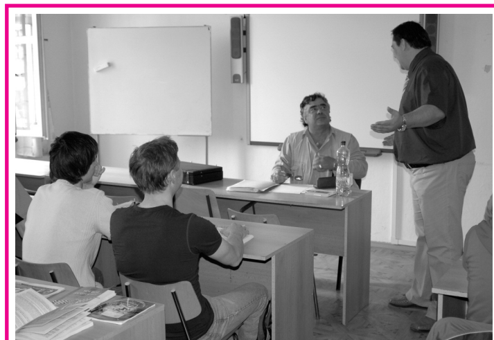
Zahájení kurzu CCV.

Organizátor si vyhrazuje právo na změnu termínu kurzu.