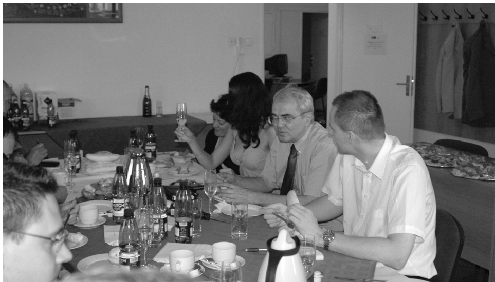
Workshop k „Inovaci studijních předmětů“ bude sloužit ke zlepšení zaměstnavatelnosti absolventů VŠERS - uzavřel práci na grantu CZ.04.1.03/3.2.15.3/0424.