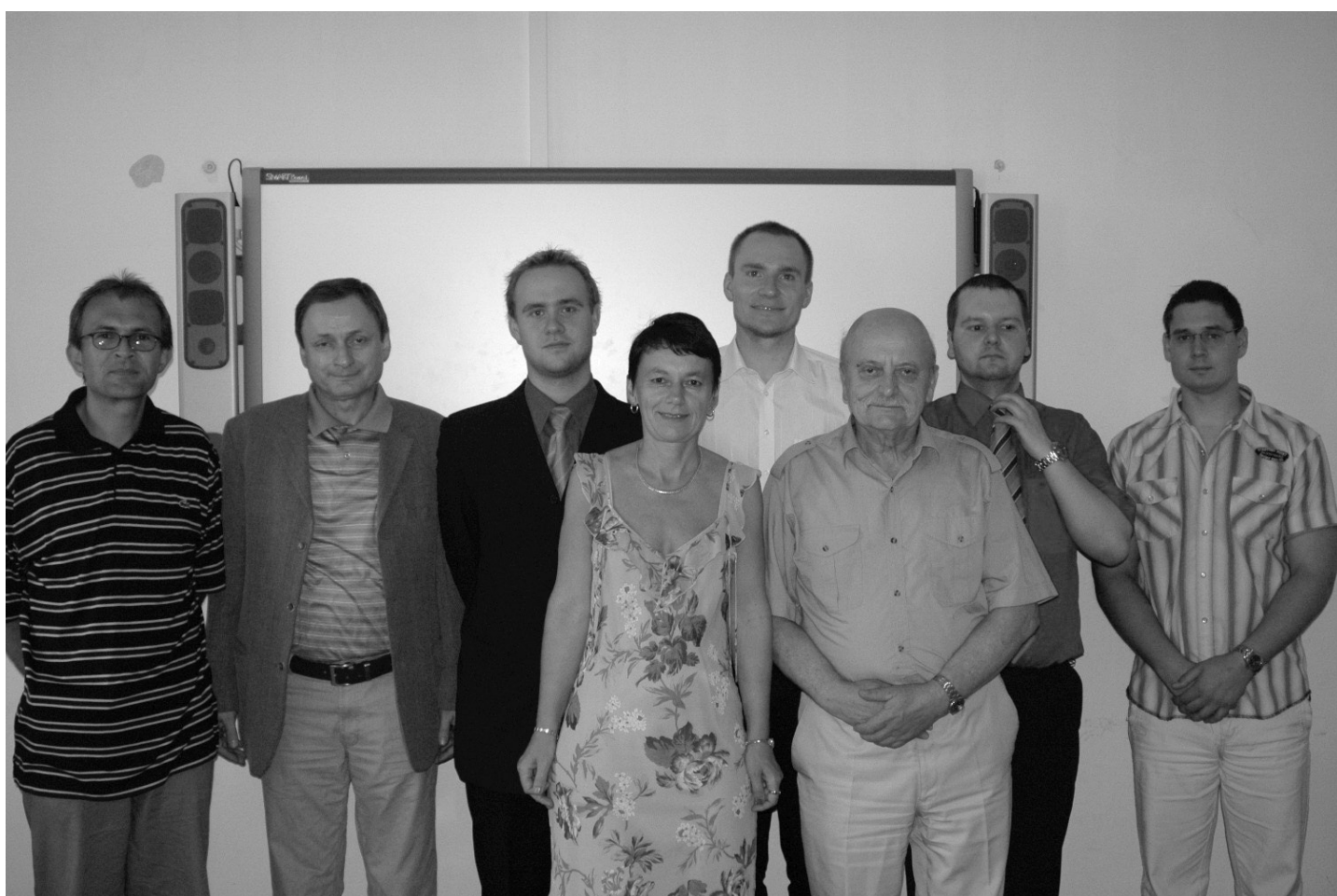
3. 6. 2008 - Poprvé zasedá nově zvolený Akademický senát VŠERS.