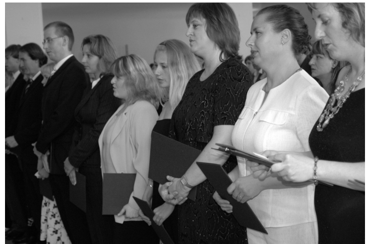
Promoce Příbram, studenti