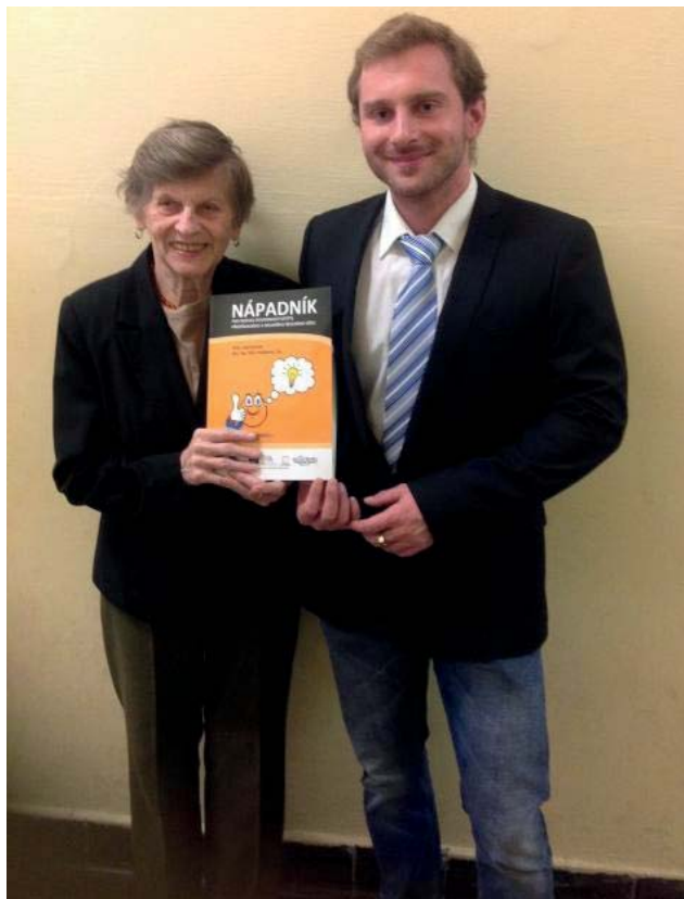
Křest nápadníku – autoři

Hravé činnosti se v Nápadníku vzájemně prolínají dle sledovaných cílů konkrétních námětů a s ohledem na různá kritéria a hlediska, podle nichž lze hry členit, není účelem tohoto příspěvku je blíže specifikovat.