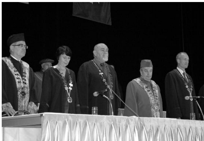
Promoce České Budějovice

vaném studiu 47 studentů, ve studiu prezenčním pak 44 studentů. V Příbrami 29 studentů v prezenčním studiu a 83 studentů v kombinovaném studiu.