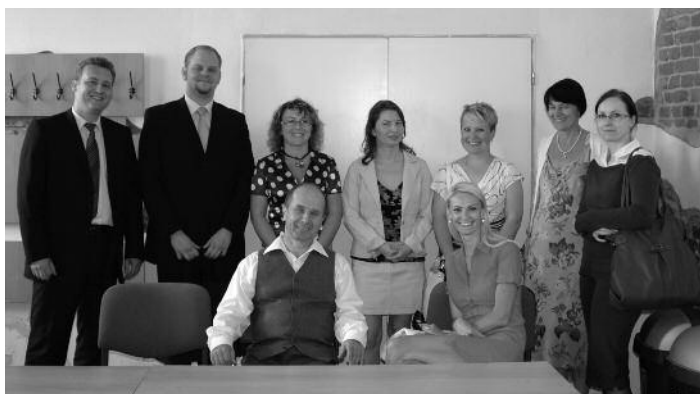
SVOČ České Budějovice