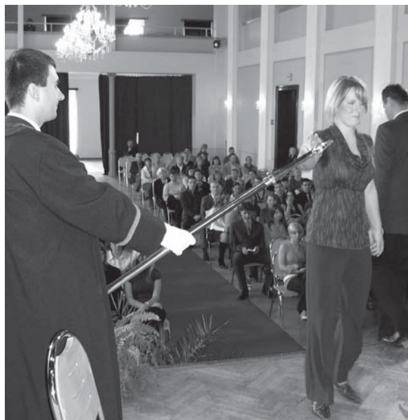
Imatrikulace na VŠERS v Č. Budějovicích - přísaha studentů.