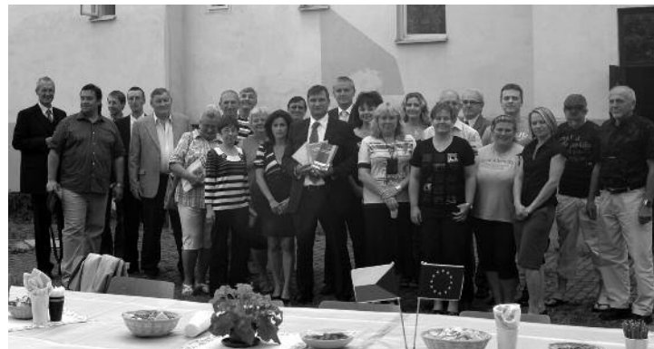
Setkání Akademické obce v roce 2011.