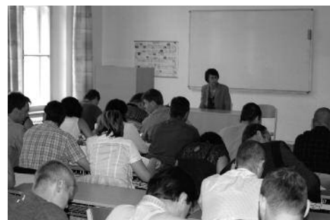
Přijímací rozhovory - Příbram.