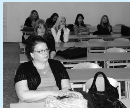
Den otevřených dveří - Příbram.