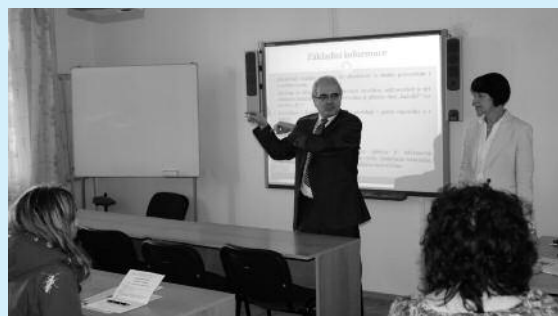
Den otevřených dveří - České Budějovice.