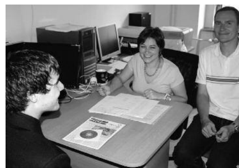
Přijímací rozhovory - České Budějovice.

Z hlediska nabízených studijních oborů je dlouhodobě největší zájem o právní a společenskoprávní obory, k jejichž stu-