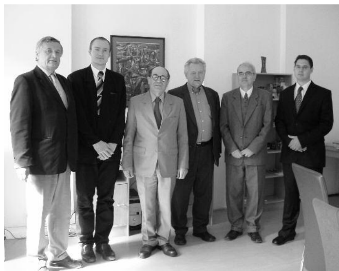
Jedním z nejvýznamnějších hostů, kteří naši školu v Příbrami v loňském roce navštívili, byl izraelský velvyslanec Yaakov Levi.