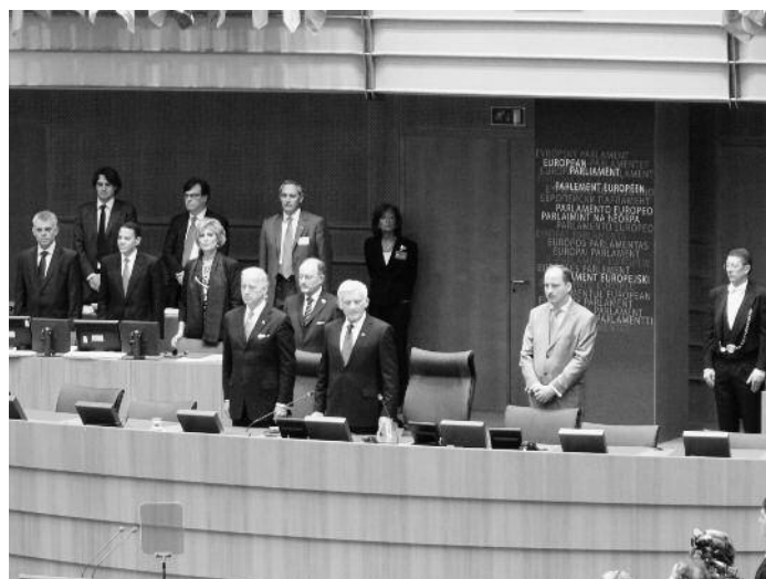
Delegace naší školy se v Bruselu zúčastnila jednání Evropského parlamentu za přítomnosti amerického viceprezidenta J. Bidena a předsedy EP J. Buzka.