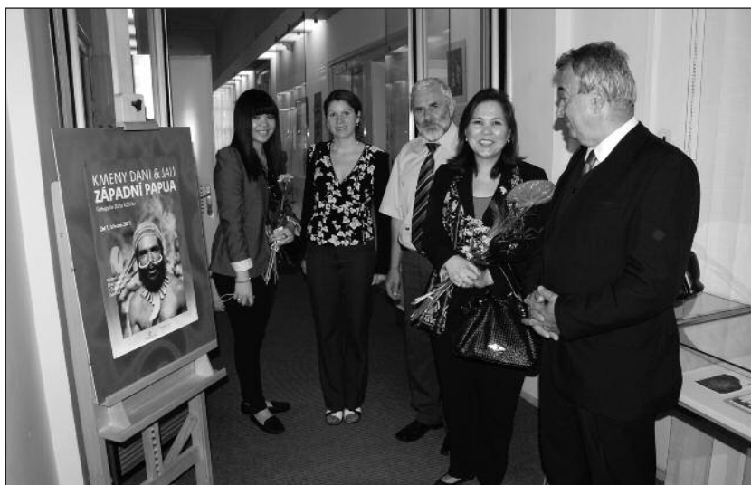
Filipínská velvyslankyně při návštěvě naší školy a Jihočeského muzea.