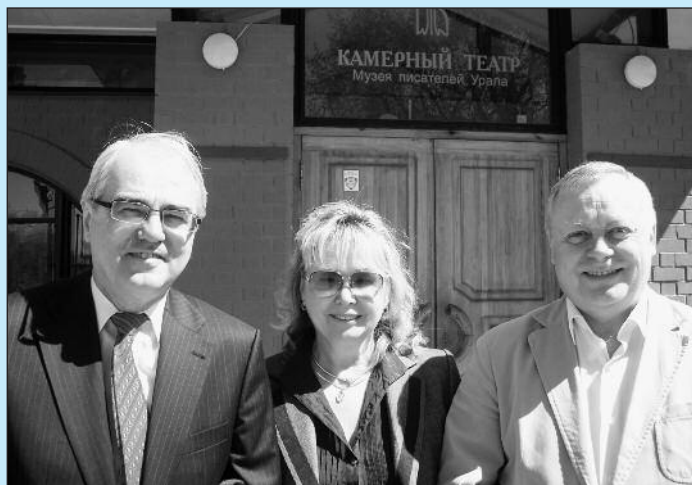
Návštěva delegace naší školy na konferenci v Jekatěrinburgu.