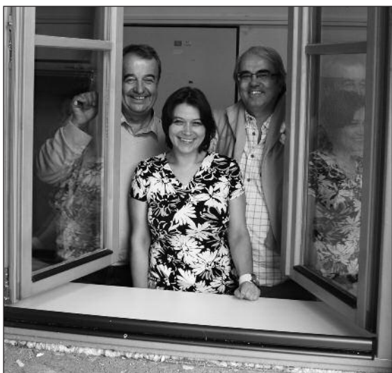
Radost z opravy budovy VŠERS v Příbrami.